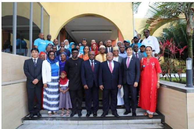
ユニセフ事務所スタッフとコモロ政府側代表との記念撮影