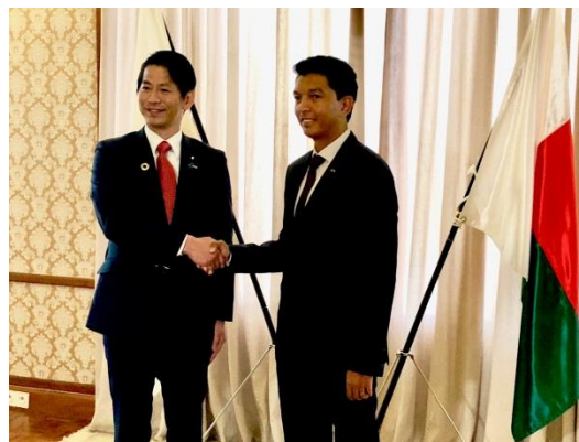
山田外務大臣政務官とラジョリナ大統領