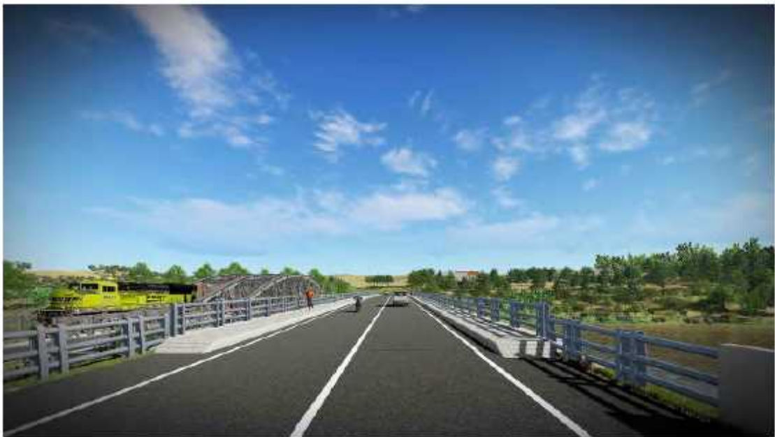
Dessin prévisionnel du Pont de Mangoro à l'achèvement (2)