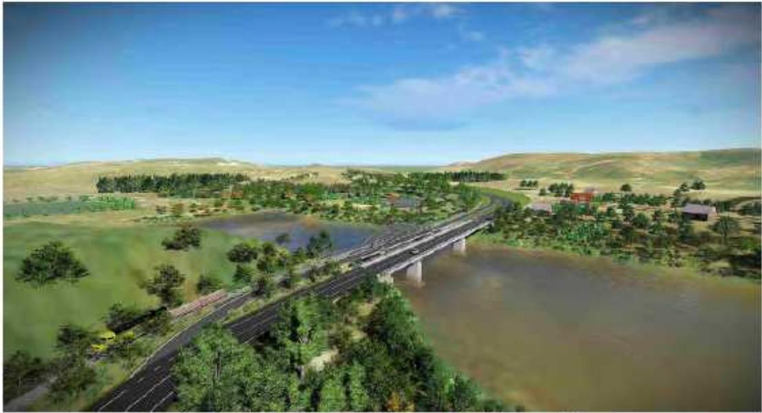
Dessin prévisionnel du Pont de Mangoro à l'achèvement (1)