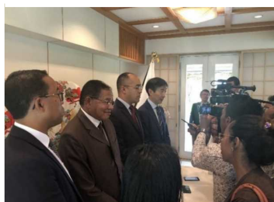
Interview avec journalistes

Voici le texte de l'allocation de l'Ambassadeur OGASAWARA et du communiqué de presse