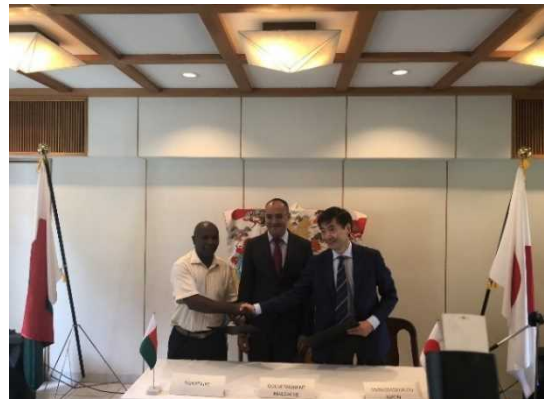
Signature du projet de L'EPP d'Ambatobe