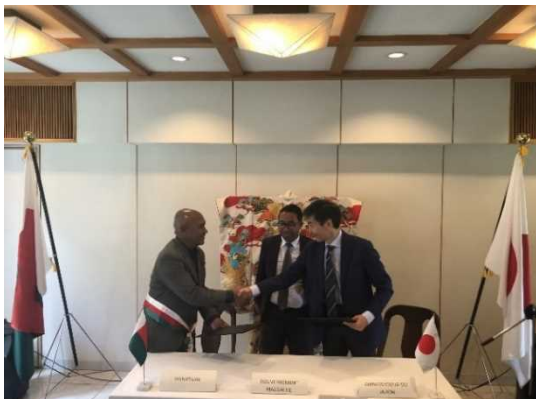
Signature du projet d'Ambohimanga Rova

La santé, y compris l'amélioration d'accès à l'eau potable et l'éducation sont toujours les domaines prioritaires dans la politique japonaise de coopération pour Madagascar. L'Ambassadeur Monsieur OGASAWARA réaffirme la volonté du Japon d'accompagner sérieusement et sincèrement les autorités malgaches dans leurs efforts pour améliorer l'accessibilité à la santé publique et à l'éducation nationale.